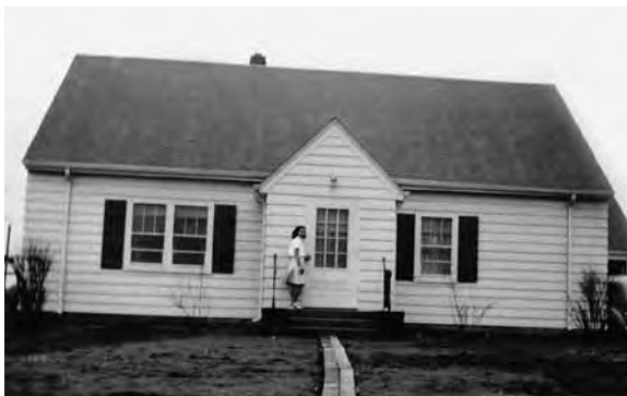
La nova casa baghegiada igl onn 1940

Questa stad hai jeu rugalau giu pervia dad ir atras la farma cun la viafier. Per l'entira farma han ei stuiu pagar sco jeu vevel pagau. Quei ei stau in bi migliac daners. Ussa hai jeu avunda da far sco jeu vi.