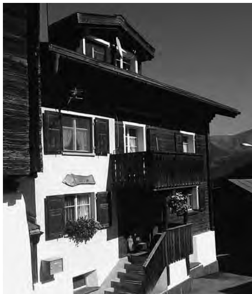
A Surrein, la casa habitada da Plazi Hendry avon ch'ir ell'America 1909

Pia, vegnis a capir mei? Jeu manegel che vus vegnis pli lunsch da far aschia, che da pagar onns ora taglia alla patria svizra. Spetgel sin risposta! Speranza che questas lingias anflien vus en buna sanadad sco ellas bandunan nus tuts.