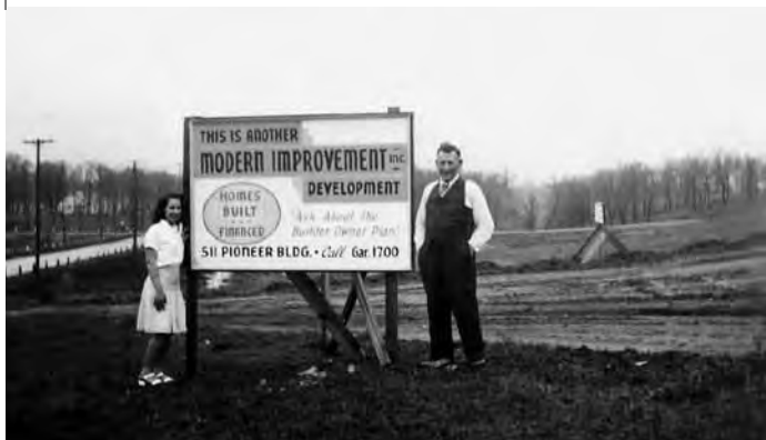
Il Plazi fa venal siu prau