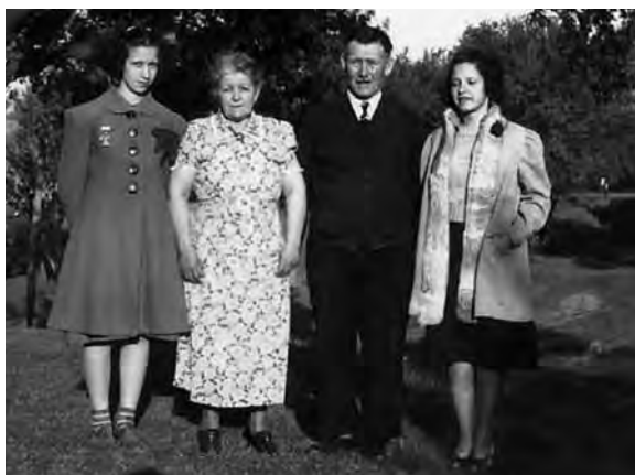
Enamiez la Margreta e Plazi, 1939

brev da vus ni da vos affons. Sche quels san era buca romontsch eis ei tuttina, san schon scriver engles, capeschel schon. Eisi aunc bia Romontschs leu? Va ei bein cun vus? Sentis fetg la crisa mundiala? Jeu haiel melli marveglias. Udis vus aunc tiels Svizzers ni essas vus burgheis digl USA?