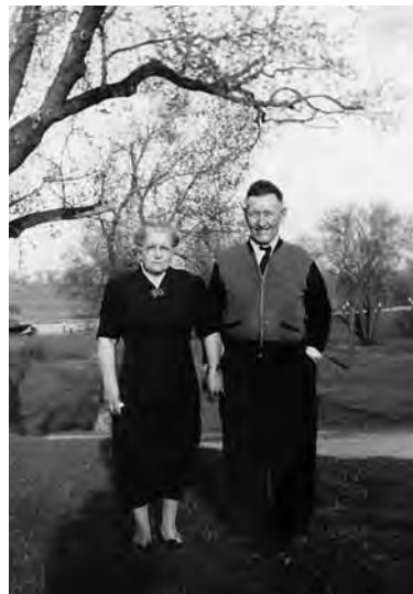
Il Plazi e la Margreta igl onn 1940

Jeu stoi ussa calar cun miu malscriver. Jeu tremblel fetg. Mo jeu sundel buca giuvens pli