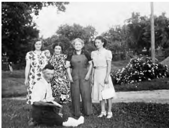
Plazi e sia dunna, secunda da dretg