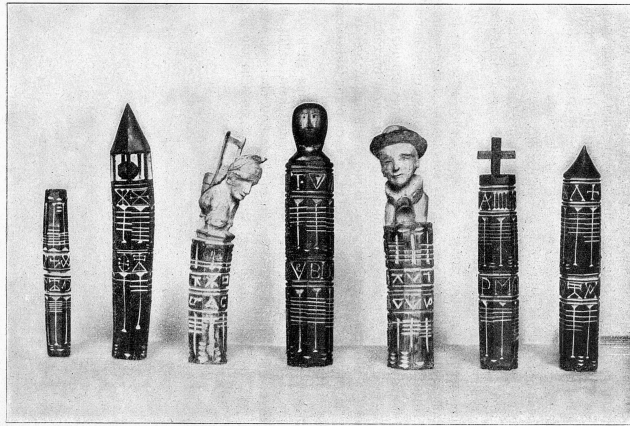
Stialas de latg ord la Val Tujetsch

Enamiez e sisum la stiala fuvan las nodas casa da mintga pursanavel. La dumengia suenter il survetsch divin liquidavan ils purs il quen da latg. Cun tagliar naven las indicaziuns da peisa vegneva quittau e confirmau la gestadad. Las nodas restavan e vegnavan magari surdadas als affons per far termagls.